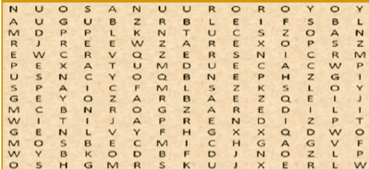
Figura 1: c, s, y z Estefanía Tébar Córdoba 2016